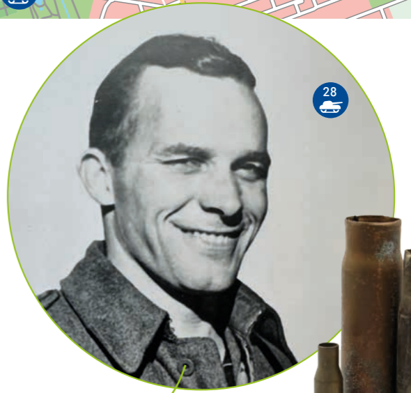
Denis Whitaker (1915-2001)